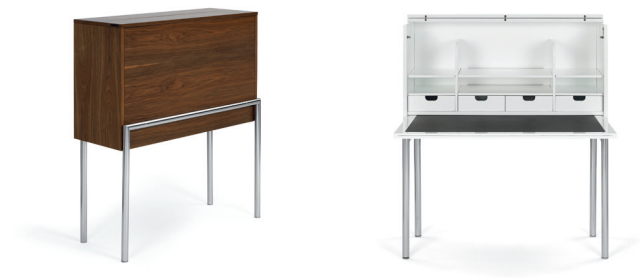
Amerikanisch Nussbaum walnut

Secretary of MDF y multietrato. Chapa de madera o en laca de brillo intenso. Superficie de trabajo plegable, cuatro cajones, estante secreto, compartimento para guardar cables y bloques de alimentación. Cerrable. Estantes parcialmente telescópicos o ajustables. Estructura de acero cromado. Patillas ajustables.