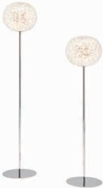
9387 CON DIMMER