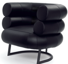
Schwarz, Leder schwarz Black, leather black